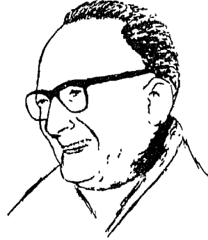
مالك بن نبي

ولد عام ١٩٠٥ في مدينة قسنطينة في الجزائر .